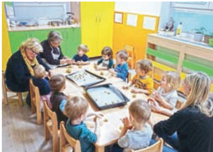
Otroci in članice društva upokojencev pri peki piškotov

Otroci in članice društva upokojencev pri peki piškotov Otroci in članice društva upokojencev pri peki piškotov Otroci v vrtcu se zelo radi odzovejo vabilu, naj se pridejo igrati k prijateljem v drugo igralnico. Še posebno, če jih tam čaka starejši brat ali sestra. Otroci starejših skupin mlajše otroke povabijo na ogled predstave, letos so jim zaigrali Mojco Pokrajculjo. Povabili so jih na skupno telovadbo in na sprehod. Medgeneracijsko sodelovanje poteka tudi med otroki iz vrtca in osnovnošolci. Učenci četrtilih, šestih in devetih razredov so hodili v vrtec in se z otroki povezali ob prebiranju slikanic in pogovoru o njih. Učenke izbirnega predmeta Vezenje so otrokom priskočile na pomoč pri učenju vezenja. Učenci izbirnega predmeta Turistična vzgoja so skupaj z otroki izdelovali plavž v različnih likovnih tehnikah. Izdelke, ki so nastali, so uporabili za šolski koledar. Tedensko nas obiskujejo učenci, ki sodelujejo v mednarodnem prostovoljskem projektu MEPI. V vrtcu lepo sodelujemo s starši, letos pa smo na obisk po-