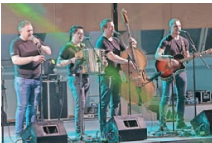
Kvartet za 5