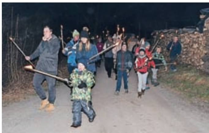
Na pohod v soju bakel se je tokrat odpravilo okoli 150 pohodnikov.