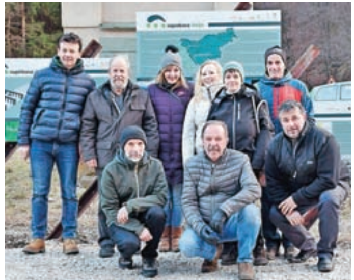
Člani komisije pred informativnimi tablamami