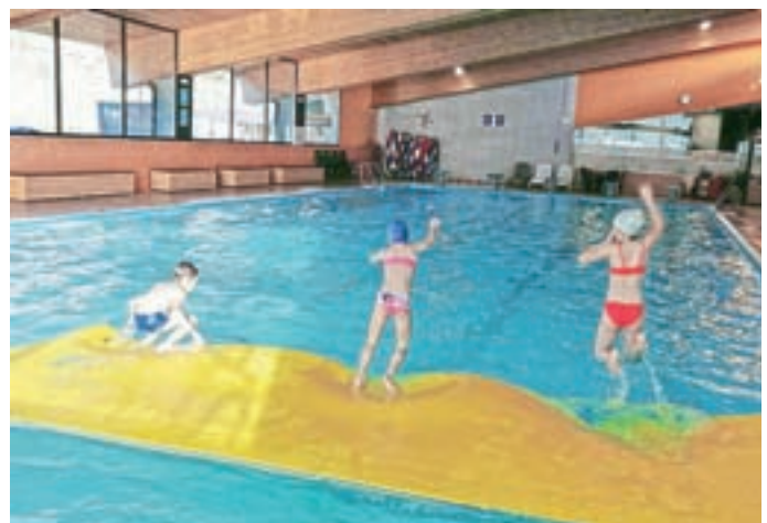
Osnovnošolce vabimo v bazen v soboto, 29. februarja, ob 16. uri.

Osnovnošolci dobro vedo, da ob torkih, sredah in četrtek po šoli lahko pridejo v mladinski center, kjer napišejo domačo nalogo, se družijo s prijatelji in igrajo družabne igre. Mladinski center je poleg tega odprt tudi vsak torek med 16. in 17. uro. V prostorih mladinskega centra se tudi ustvarja. Izdelovali so novoletne voščilnice, okraševali lončke, se pomerili v kuharskem izzivu. Dan pred kulturnim praznikom so se odpeljali v Škofjo Loko, kjer so si v Kinu Sora ogledali risanko Tačke na patrolji. Srednješolci in študentje so pripravili informativne dneve. Srednješolci so osnovnošolcem predstavili svoje srednje šole in jih skušali navdušiti za vpis. Predstavili so svoje izkušnje, koliko znanja potrebujejo, kakšni so profesorji, družabno življenje na šoli in podobno. Študentje pa so vabili