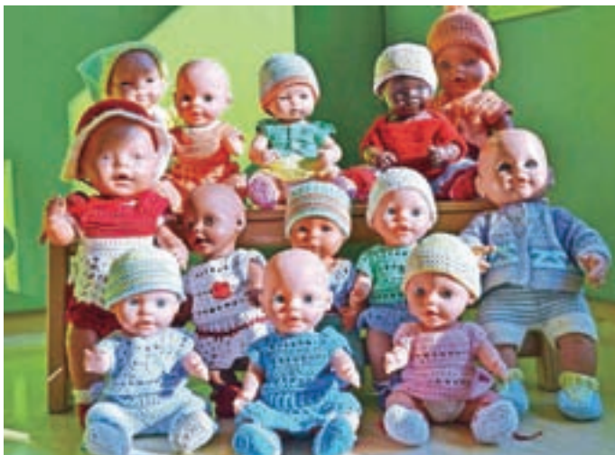
Dojenčki v novih oblačilih

Leto še ni končano, načrtovanih imamo še nekaj medgeneracijskih srečanj. Starejši otroci bodo za mlajše pripravili orientacijski pohod, za stare starše bodo zaigrali predstavo Zrcalce. Obiskali bomo gasilske veterane v PGD Selca. Folklorna skupina bo za starejše občane nastopila v CSS Škofja Loka, starejša skupina bo obiskala stanovalce Doma upokojencev Petrovo Brdo. Vzgojiteljice smo vesele dobrega odziva na srečanja v vrtcu. Ob marsikaterem dogodku smo z otroki začutili, kako lepo je, če drug drugemu nekaj podarimo. In da je najlepše, kadar drug drugemu podarimo delček sebe.