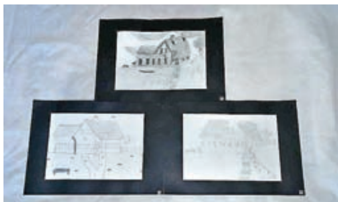
V okviru likovnega natečaja so učenci ustvarjali na temo Ratitovca.