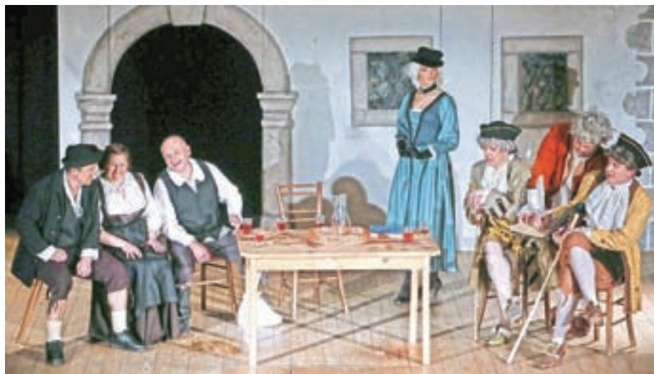
Igralci Kulturnega društva Scena navdušujejo z Linhartovo komedijo Županova Micka.