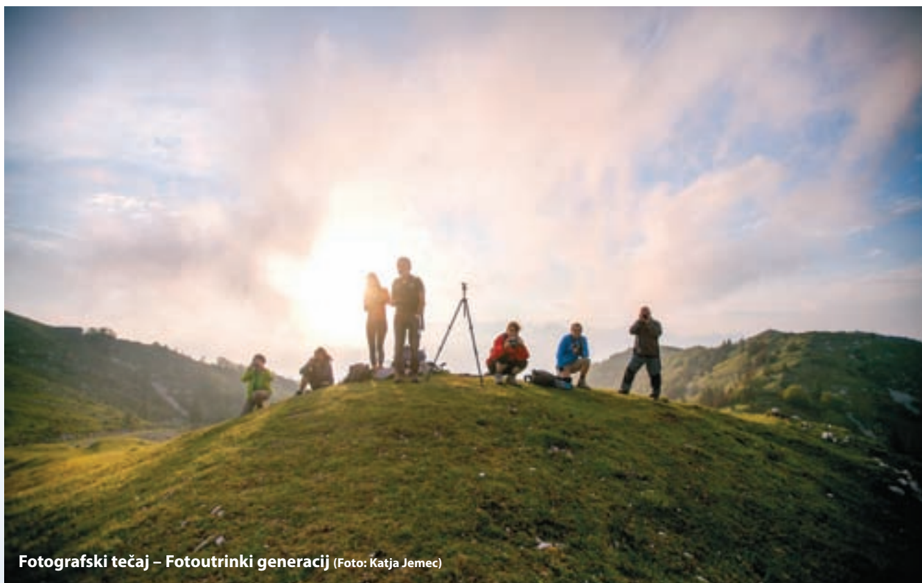
Fotografski tečaj – Fototrinki generacij