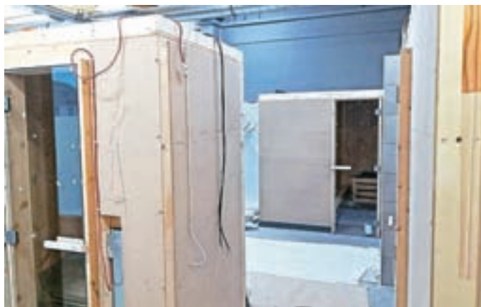
Savne v delu

V prenovljenem prostoru, kjer se sedaj nahajajo savne, bodo obiskovalcem na voljo tri različne savne. Tako kot prej bo tudi sedaj na voljo finska savna, ki bo sprejela osem oseb, bio savno bo naenkrat lahko obiskalo šest oseb, medtem ko bo infrardeča savna namenjena dvema osebama. Vse skupaj pa povezuje predprostor, ki bo namenjen počitku in osvežitvi. Cene vstopa, tako v bazen kot savno, za zdaj ostajajo take, kot so bile, prav tako so v veljavi še stare vstopnice. Tudi v prihodnje bo mogoče kupiti vstopnico samo za bazenski del, samo za savno in pa kombinacijo bazen in savna. Vstop v celoten