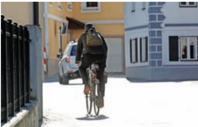
Kolesarska povezava Železniki–Selca bo izboljšala varnost kolesarjev.

Pri točki o zemljiških zadevah je občinski svet ukinil statusa javnega dobrega na nekaterih občinskih zemljiščih ob prtokih Češnjica, Dašnica in Prednja Smoleva ter dovolil brezplačni prenos na državo za potrebe ureditve poplavne varnosti.