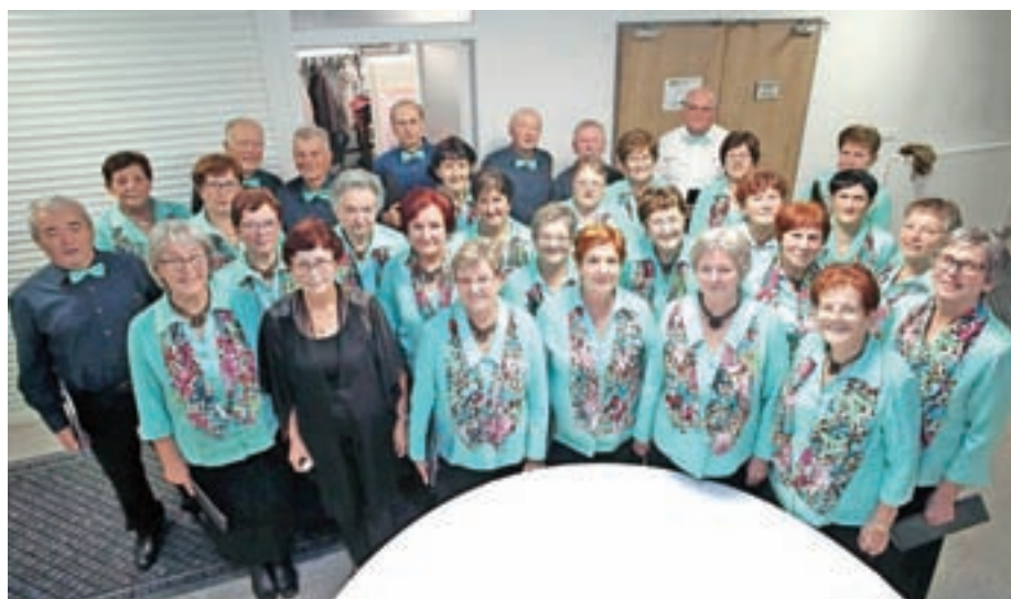
Mešani pevski zbor Društva upokojencev za Selško dolino

Rdeča nit vseh naših vaj pa je bila že dalj časa priprava na četrto stoletja delovanja zbora. V tem času se je zamenjalo 58 pevcev, sedaj nas je 32. Spomnili smo se petih pevk, ki prepevajo že od vsega začetka. Zelo smo bili veseli bivših članov, ki so nas prišli poslušat. Za zbor lahko rečem, da najraje pojemo pred domačim občinstvom, s posebnimi občutki pa v domovih za starejše občane. Lani smo jim zapeli v Škofji Loki, v domu v Medvodah in v Bohinjski Srednji vasi. Vsako leto se udeležimo revije upokojenskih