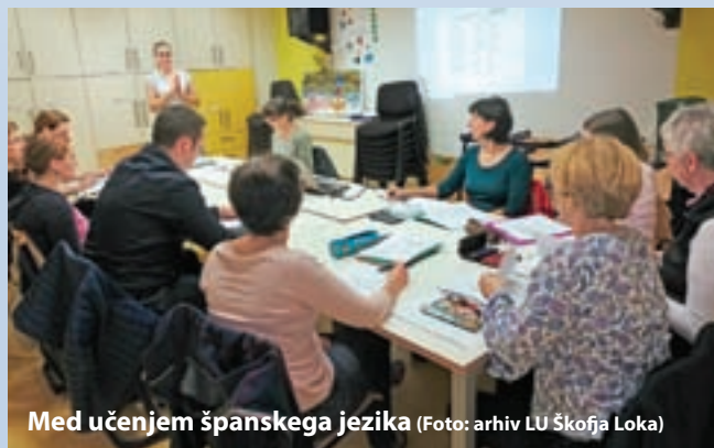
Med učenjem španskega jezika

V prihajajočih mesecih vam želimo prijetno učenje v dobri družbi!