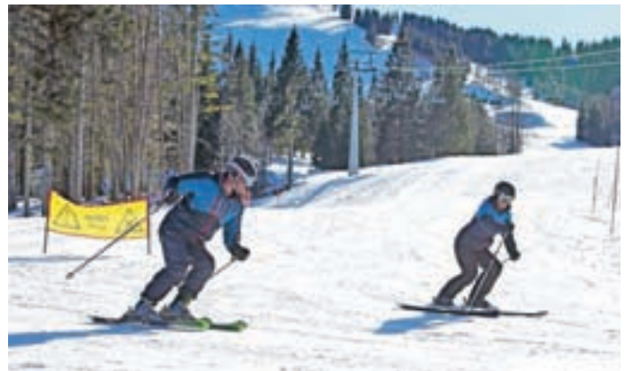
Na Soriški planini je bil januarski obisk primerljiv z lanskim, v prvi polovici februarju pa je bil 30 odstotkov manjši.

stralije, Kanade, Kitajske, Srbije ..., ki so trenirali za Pokal Loka. V začetku februarja je na Rudnem prvič potekala FIS-tekma v paralelnem slalomu z mednarodno udeležbo mladih smučarjev nad 17 let. Gostijo različne sindikalne tekme, sicer pa ŠD Buldožerji prireja tudi Pokal Rudna v veleslalomu. Na prvi tekmi je bilo okoli 70 smučarjev, na drugi še deset več, tretja, zadnja tekma pa bo na vrsti zadnjo soboto v februarju. Otroški smučarski park s 70 metrov dolgo otroško vlečnico, ki so ga uredili pred to sezono, se je po besedah Gartnerja izkazal za odlično pridobitev. Namenjen je učenju prvih smučarskih zavojev, s čimer so deloma razbremenili daljšo, zahtevnejšo proggo, otroci pa so ob prehodu nanjo boljše pripravljene. "Med počitnicami se nadejamo dobrega obiska. Zasnežena je tudi sankaska progga," je dejal Gartner. Če bodo vremenske razmere ugodne, bodo obratovali do sredine marca.