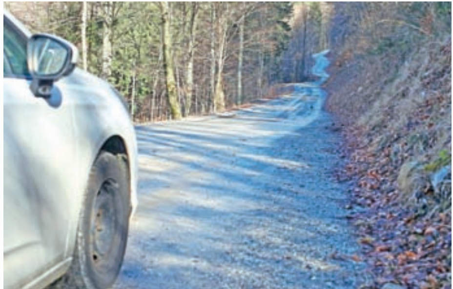
Ena od večjih investicij v ceste bo ureditev makadamskega odseka Šurk–Ravne.

Letos naj bi izvedli tudi investiciji, za kateri je državni direkciji za infrastrukturo lani zmanjkalo denarja. Gre za ureditev odvodnjavanja in uvoza pred